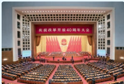
2018年12月18日，庆祝改革开放40周年大会在北京隆重举行