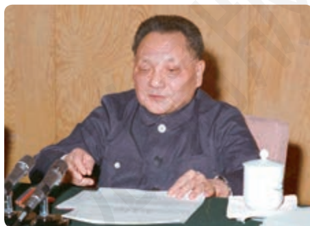
邓小平在党的十一届三中全会上

“文化大革命”结束后，在党和国家面临何去何从的重大历史关头，1978年12月召开的党的十一届三中全会重新确立了马克思主义的思想路线、政治路线和组织路线，确定把党和国家工作的重点转移到社会主义现代化建设上来，作出实行改革开放的重大决策，实现了中华人民共和国成立以来党的历史上具有深远意义的伟大转折，开启了改革开放和社会主义现代化建设新时期。