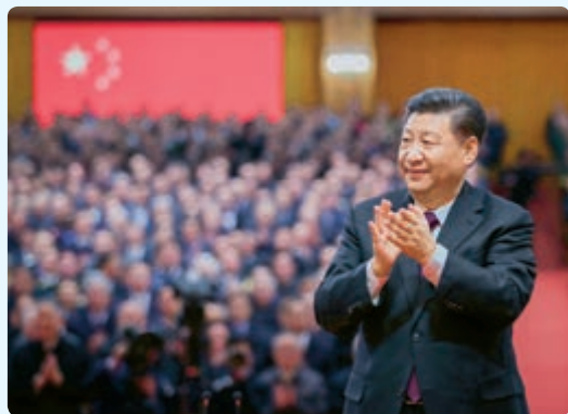
在庆祝改革开放40周年大会上，习近平鼓掌向受表彰人员表示祝贺

1978年以来，中国改革全面推进，对外开放向纵深发展。改革开放极大改变了中国的面貌、中华民族的面貌、中国人民的面貌、中国共产党的面貌。中华民族迎来了从站起来、富起来到强起来的伟大飞跃，中国特色社会主义迎来了从创立、发展到完善的伟大飞跃，中国人民迎来了从温饱不足到小康富裕的伟大飞跃。中华民族正以崭新姿态屹立于世界的东方。